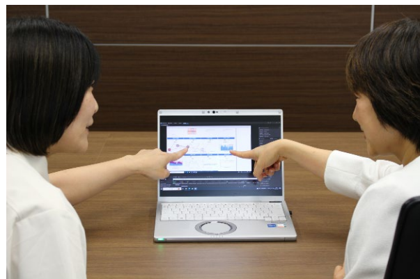
図2：マジ神との視線解析・インタビューの様子

介護の「匠」や「熟練者」の持つ「コツ」の抽出は、従来は主にインタビュー等の主観データに基づいて行われてきましたが、本研究の特徴は「視線」という客観データを導入した点にあります。視線解析自体は、モノやシステムのユーザビリティ（使いやすさ）の検証やマーケティングリサーチ等で多く用いられてきているほか、近年では様々な分野における暗黙知の解明に用いられることも増えています。しかし、介護分野で視線解析を利用した研究はあまり見られません。