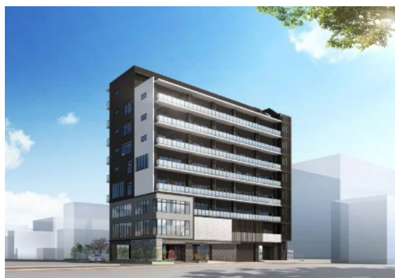
メディカル・リハビリホームグランド熊本白川桜町／外観（完成予想CG） 【土地建物の所有形態：事業主体非所有】

開設に先立ち、入居を検討されている方を対象に、「 完成披露内覧会（入居相談会） 」を11月1日より現地にて開催を予定しておりますので、併せてお知らせいたします。